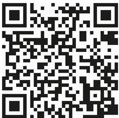
Codul QR WhistleB

Lista membrilor rețelei o veți găsi pe intranetul Renault Group, în partea de jos a paginii de start, în secțiunea „Legături utile” „Etică și Conformitate”, rubrica „Cine suntem?”.