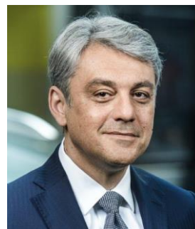
Luca DE MEO Director General